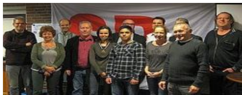
De top van onze kandidatenlijst, bijna compleet.

Het was niet alleen gezellig, ook werden na stevige discussies belangrijke besluiten genomen over het programma, lijstverbindingen en de campagne voor de aanstaande raadsverkiezingen.