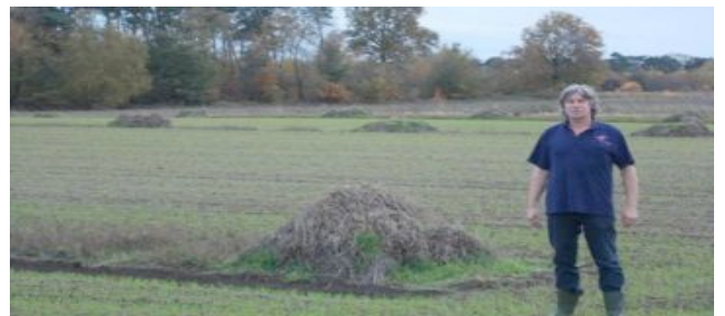
Typisch Wiel, gedreven vertellend over de natuur.

Wiel was actief als trainer van verschillende verenigingen in het amateurvoetbal. Maar ook vrijwel dagelijks te vinden in het natuurgebied Krayelheide om leiding te geven aan de vrijwilligers en daarnaast wandelingen met uitleg verzorgde. Ook begeleidde hij psychische patiënten die bij de Stichting tot rust kwamen, en jongeren met een taakstraf, die het natuurgebied onderhielden en schoon hielden. Wiel zorgde dat het ingezamelde zwerfvuil ( wekelijks 1 container! ) werd opgehaald en regelde het onderhoud van de moestuin, waterafvoer, houtopslag en imkerij.