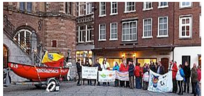
Samen met diverse verenigingen en gebruikers voerde de SP in 2010 regelmatig actie voor het behoud van het zwembad. Zoals hier bij het Venlose stadhuis met spandoeken en de boot van de Tegelse Reddingsbrigade.

De SP heeft geregeld om informatie verzocht, werd geconfronteerd met onderhandelingen in de achterkamer, en constateert dat er sinds september 2010 weinig concreet is gebeurd. Aanleiding voor de partij om het College opnieuw te bevragen naar de werkelijke stand van zaken, desnoods in vertrouwen. Dit laatste is ook voor de SP uniek, we zijn tenslotte als partij per definitie voor openheid in het bestuur. Maar de belangen van de gebruikers en personeel wegen voor ons zwaarder dus desnoods in vertrouwen als we maar helderheid krijgen.