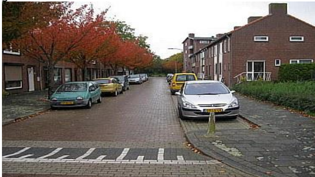
Paulus Potterstraat ligt tussen Veldenseweg/Straelseweg.

"Misschien kan er wat gedaan worden aan het groen", klinkt het bij de meeste bewoners. Dan gaat het vooral over de bomen, waarbij de wortels de trottoirtegels omhoog drukken, en daarnaast maakt de toegenomen (uit)groei van de takken het lappen van de ramen op de verdieping lastig. De bomen kun je dit niet kwalijk nemen en de gemeente bezuinigt op het groenonderhoud.