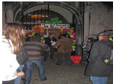
Het stadhuis kende nog nooit zo veel actiemomenten en volle publieke tribunes!

Het zwembad blijft dus tot de zomervakantie open. Dus meer tijd om rond te kijken en na te denken over mogelijkheden. Meer konden we er niet uit slepen. We hebben ons stinkende best gedaan en wilden veel meer maar daar was helaas geen politieke meerderheid voor. De komende zeven maanden zullen bepalend zijn voor de toekomst van het zwembad. We zullen het van dichtbij blijven volgen en de vinger aan de pols houden! De politiek weet nu dat ze niet zo maar even iets kan beslissen, men weet dat de SP en duizenden mensen het in de gaten houden.