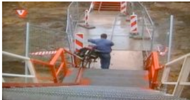
De oversteek op het Koninginneplein is voor velen een ware hindernis.

Ook werd de strategische visie tot 2030 besproken. Geen unieke visie want ze is ongeveer hetzelfde als alle omliggende gemeenten dus schieten we weinig op. Het blijft bij dromen zonder realistisch te kijken naar mogelijkheden en vooral beperkingen.