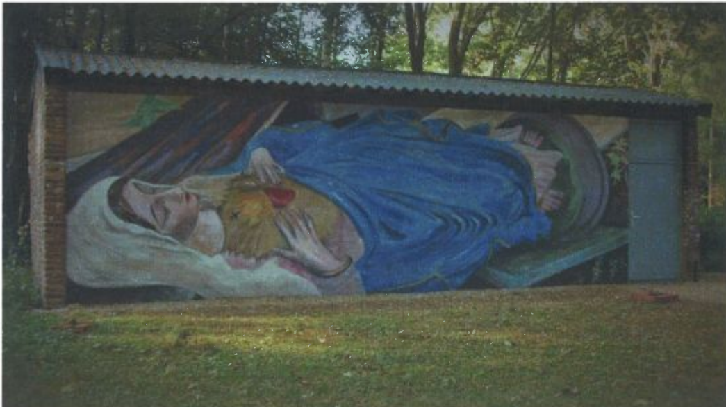
Grote Maria-schildering op de muur van een bijgebouw van het Kapelletje van Genooi, Mural Gies Backes, 2016