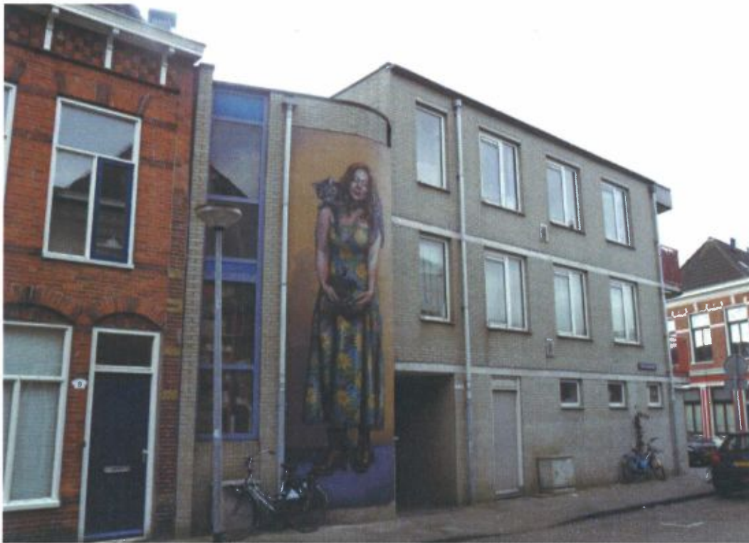
Een schildering door Michel Velt in 2013 van een meer dan levensgroot afgebeelde vrouw met kauw en kat siert de gevel van een portiekflat aan de Korte Nieuwstraat in de wijk Oosterpoort & Europapark in Groningen..