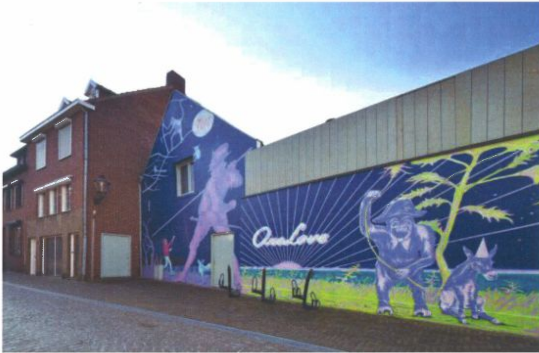
Night is for dreaming. Mural Gies Backes, Picardi Venlo, 2014