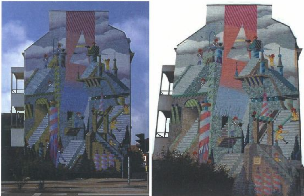
De 15 meters hoge en 10 meters brede mural 'Grenzenloos samenwerken' in Maastricht die in 1991 door Eddie Van Hoef werd geschilderd. (links de gevel in 1991, rechts 2012).